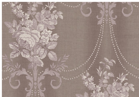
«Атласный букет с тенями»