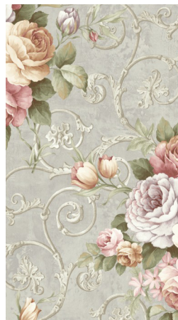
«Букеты цветов и завитки»