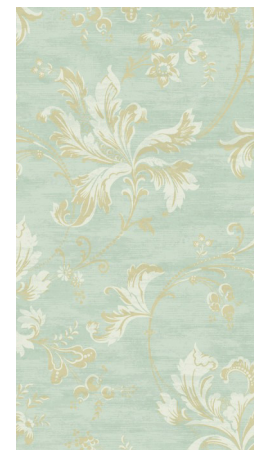
«Фигурные цветочные узоры»