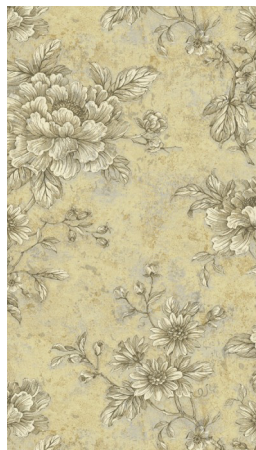
«Розы и завитки»